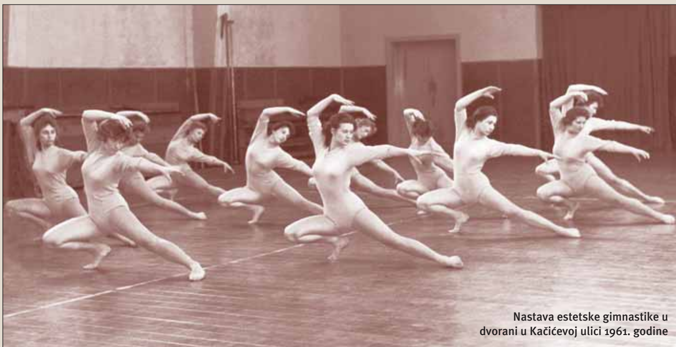
Nastava estetske gimnastike u dvorani u Kačićevoj ulici 1961. godine

se mogli kao završeni studenti prvog stupnja (dvogodišnji studij), uz polaganje razlikovnih ispita, upisati na treću godinu studija na Visokoj školi za fizičku kulturu. Također su izrađeni i prvi nastavni planovi i okvirni programi studija usmjerenja za obavezni nastavni smjer za nastavu TZK-a u školama te izborni smjerovi: estetski smjer, sportski smjer (viši sportski treneri), smjer rekreacija i smjer kineziterapija 10 .